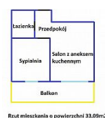
Rzut mieszkania o powierzchni 33,09m 2