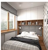
kamie po wydzieleniu sypialni oraz garderoby